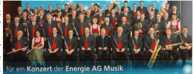
für ein Konzert der Energie AG Musik

Am Sonntag 1. Juli kann es ein einzigartiges Dorffest am Kirchenplatz geben. Der Frühschoppen wird von der Energie AG-Musik OÖ. gestaltet. Unter Einbindung der Vereine und der Gasthäuser, wollen wir auch ehemalige Puchkirchner und natürlich die neu zugezogenen begrüßen. Die Planungen