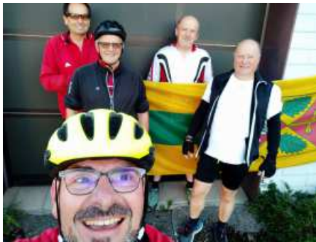
Glocknerpartie zum 18. Mal

geht's – mach ein Foto und schick es per mail an gemeinde@puchkirchen.ooe.gv.at – unter den Teilnehmern werden einige Preise verlost.