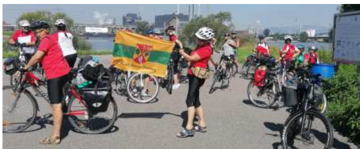
Fahrrad-Ausflug Turnerinnen (Linz - Spitz - Rossatz - Wachau)