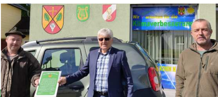
Gemeindenachrichten Puchkirchen am Trattberg

Der Wald und Ihre Benutzer brauchen Benützungsregeln, eben für Mensch und Tier. Ein gutes Miteinander verlangt Rücksicht, denn so können viele die Freude der Schöpfung spüren. Unsere Jägerschaft trägt ihre Verantwortung Rechnung und bearbeitet ihre Aufgaben im guten Miteinander. An Waldwegen werden die zum Nachdenken anregenden Hinweistafeln von den Jägern angebracht – ein fröhliches Weidmanns-Heil.