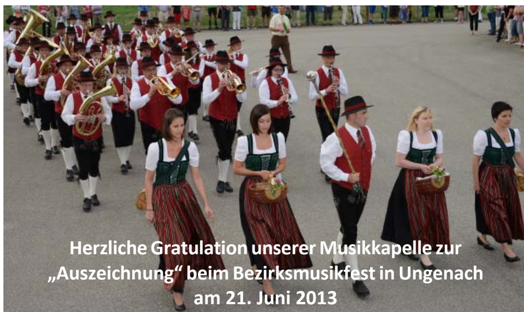
Herzliche Gratulation unserer Musikkapelle zur „Auszeichnung“ beim Bezirksmusikfest in Ungenach am 21. Juni 2013