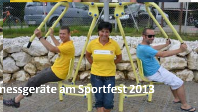
Eröffnung der Outdoorfitnessgeräte am Sportfest 2013