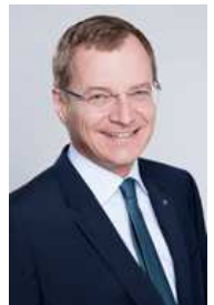
LH-Stv. Mag. Thomas Stelzer

mit Herrn Landeshauptmann-Stv. Mag. Thomas Stelzer und dem Musikverein Puchkirchen und dem Jugendorchester.