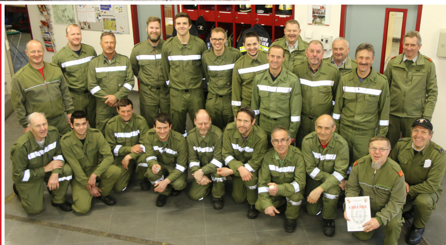
FF Puchkirchen & FF Pichl

Für einzelne Funktionen werden gesonderte Voraussetzungen gefordert (Lehrgänge der LFS, Lenkerberechtigungen,...).