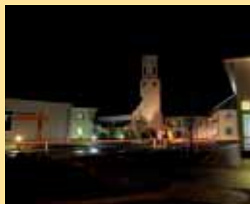
St. Jakob nimmt hinweg die Not, bringt erste Frucht und frisches Brot. Bauernregel