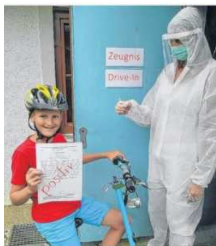
Fürthauer aus Puchkirchen holte sich den ersten Platz.

Auch in Zukunft soll unsere Jugend sicher von Veranstaltungen nach Hause kommen. Die Gemeinde macht beim überregionalen EU-Projekt mit und wird weiterhin eine Kostenbeteiligung zur Verfügung stellen.